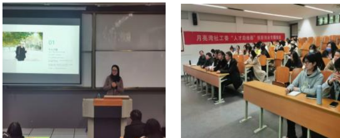
图7 因为相信，所以遇见——蒙特梭利分享会

现场学生专注聆听主动回应问题，在交流环节积极举手提问，营造出活跃的交流互动氛围。