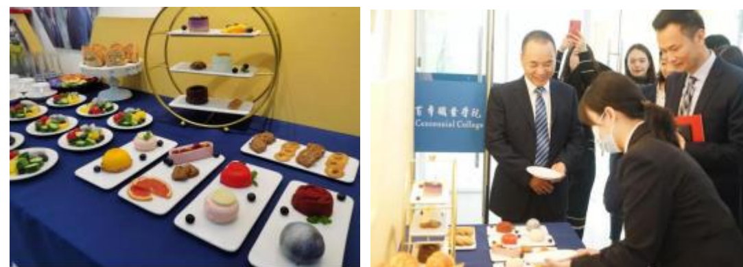
图8 酒店管理专业学生们制作的精致茶点