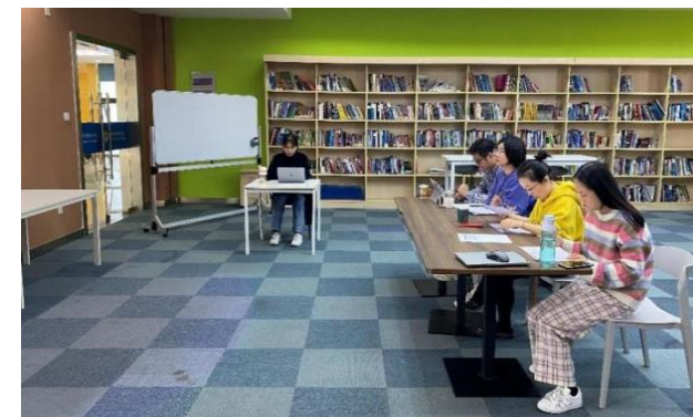
图 16 博雅学院英语口语大赛初选现场

为深入贯彻我校“国际化、专业化、品质化”的办学理念，同时为省内以及全国大型英语类比赛选拔高潜力选手，我院举办了苏州百年职业学院 2021 年学生英语口语大赛初选（以下简称口语大赛）。经由英语课程教师推荐与征求学生本人参赛意愿后，全校共有 26 位同学提交英文答题视频。经过评委会全面评审后，最终有 9 名同学成功晋级校级口语大赛初选。