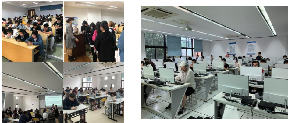
图 13 入学测试现场

为更好立足我校“国际化、专业化、品质化”的办学理念，苏州百年职业学院于 2021 年启动由我院负责实施的外语教学体系改革。为推进英语教学改革工作的顺利进行，在学校校领导、教学科研处、学生工作处、招生就业处与各二级学院的密切配合下，我院根据教学工作安排，于 2021 年 10 月 12 日针对 21 级新生分别举行了中加共建英语课程和 CC 英语课程的入学分级测试。