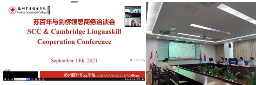
图 17 苏百年与剑桥领思商务洽谈会现场

凝心聚力谋发展，携手共进开新篇——苏百年与剑桥领思商务洽谈会圆满结束 2021年9月13日下午两点半在G栋五楼会议室召开了与剑桥领思的商务洽谈会。校长助理张丽、校长助理袁祥，教学科研处处长贾长云教授、博雅学院院长张柯冉、副院长马琳、剑桥领思中国运营中心副总经理孙真与区域经理李丽参加此次会议。此次合作，将进一步助力我校外语教学体系改革，同时也为下一步共建校企实训基地等系列合作育人计划奠定了基础。