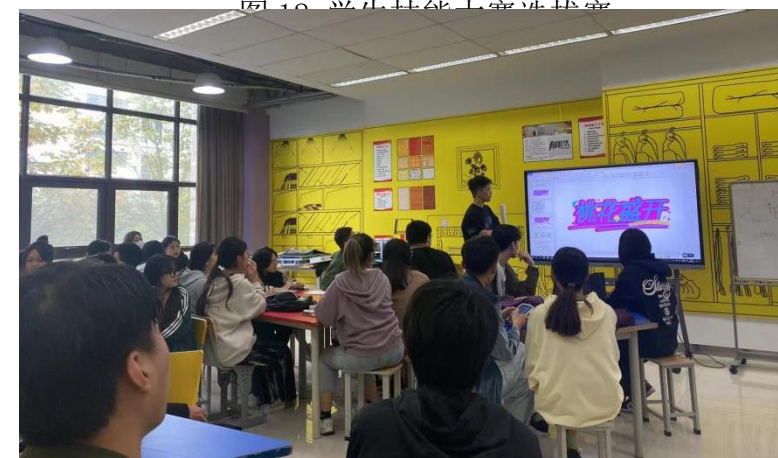
图12 学生技能大赛选拔赛