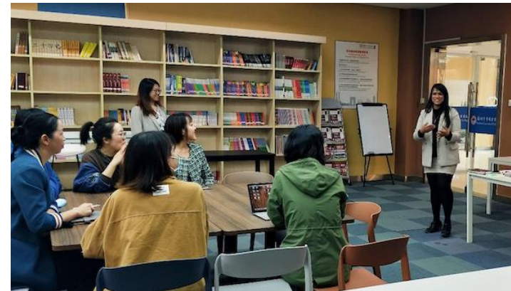
图 15 苏百年第二期教职工英语培训见面会