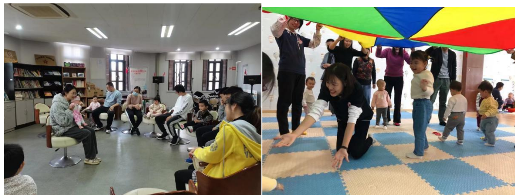
图9 婴幼儿托育服务与管理专业同学们进