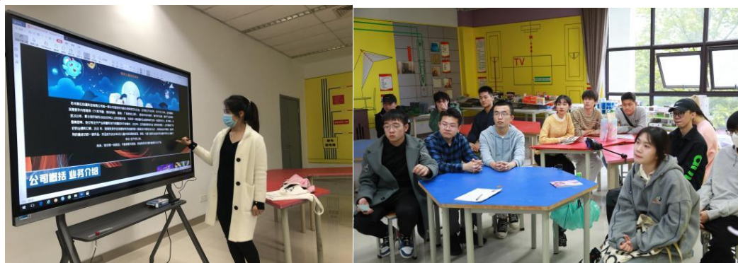
图10 毕业生宣讲招聘会

2. 深入推进校企合作，为用人单位和毕业生搭建“用人”和“求职”的桥梁，持续为广大毕业生提供形式多样、信息丰富的就业指导和服务，促进我院毕业生充分顺利、高质量就业。10月20日在GN204教室顺利举办2022届毕业生宣讲招聘会。