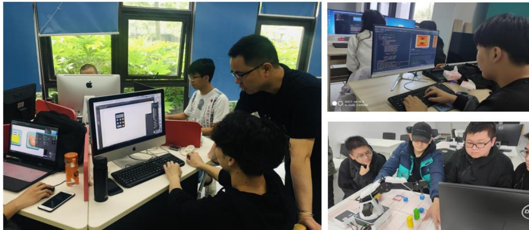
图 3 实训课程&项目化课程实践环节