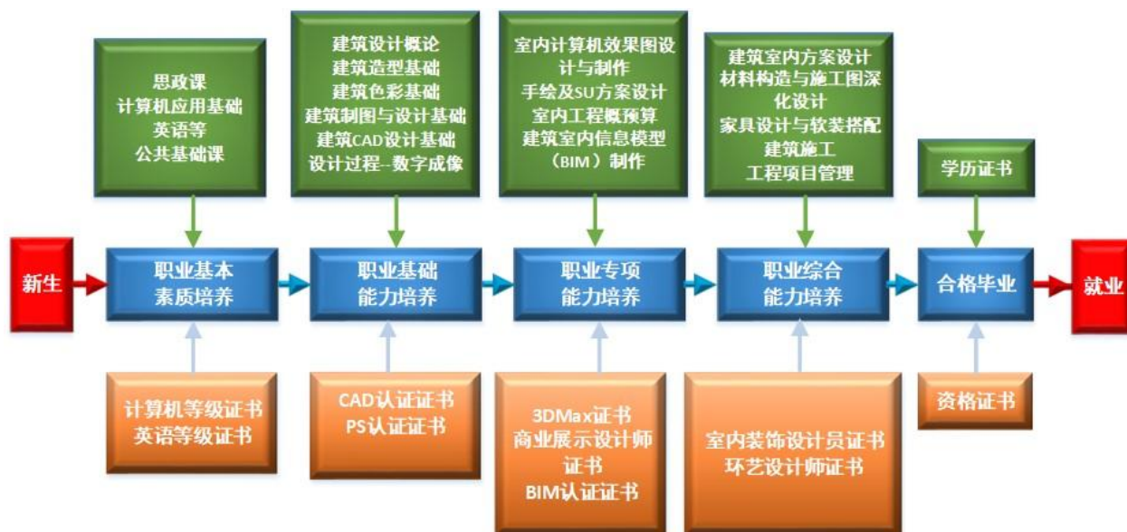
表 1 共建专业课程学时、学分分配表